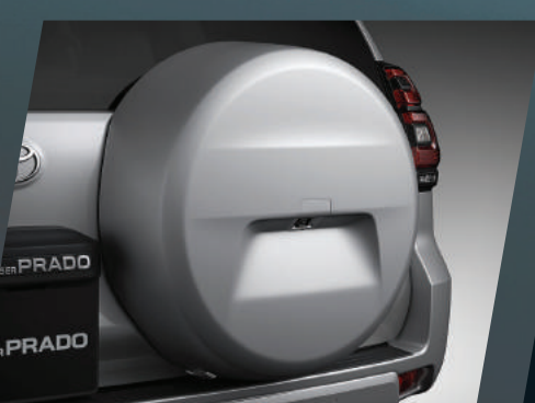
LLANTA DE REPUESTO VERSIÓN TX-L