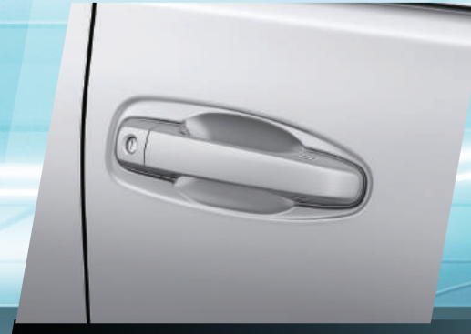
MANIJAS EXTERIORES VERSIÓN TX-L