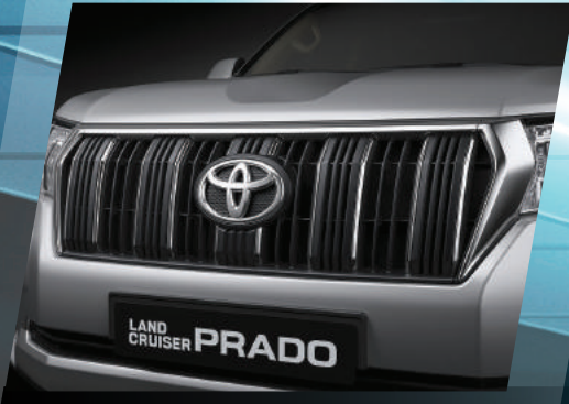
PARRILA VERSIÓN TX-L