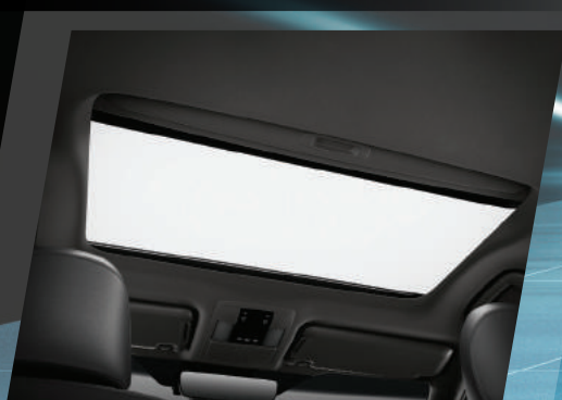
TECHO CORREDIZO VERSIÓN TX-L