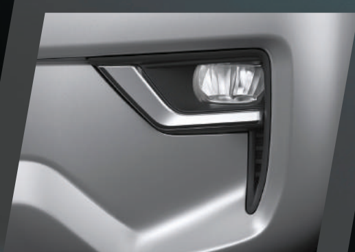
EXPLORADORAS VERSIÓN TX-L